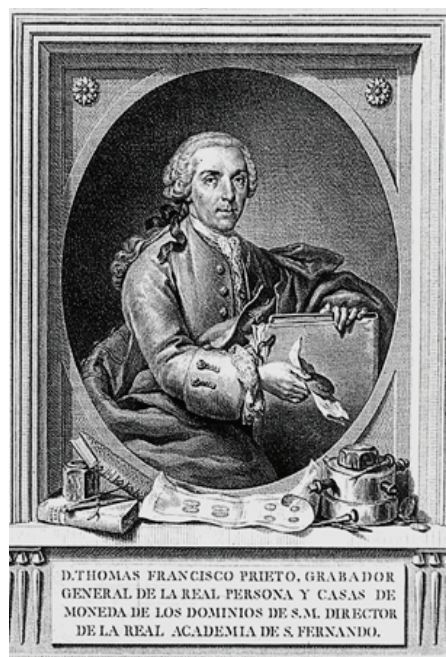
Fig. 3.-El grabador Tomás Francisco Prieto, dibujado por Antonio González Ruiz y estampado en lámina por Manuel Salvador Carmona

Aunque la disposición regia es de febrero del año 1772, resulta claro que la implantación del nuevo prototipo de moneda de busto estaba prevista desde dos o tres años antes. Es un tema que no hemos investigado personalmente. Pero resulta clara tal afirmación si analizamos los dos bellísimos prototipos moldeados en cara roja y el tallado en metal que se conservan en el Museo de la Real Casa de la Moneda de Madrid, todos ellos firmados en el año 1770 por el legendario artista salmantino Tomás Francisco Prieto (Salamanca 1716-Madrid 1782) 8 , que desde el año 1748 ejercía el cargo, por nombramiento real, de “grabador general de la Real Persona y Casas de Moneda de los dominios de