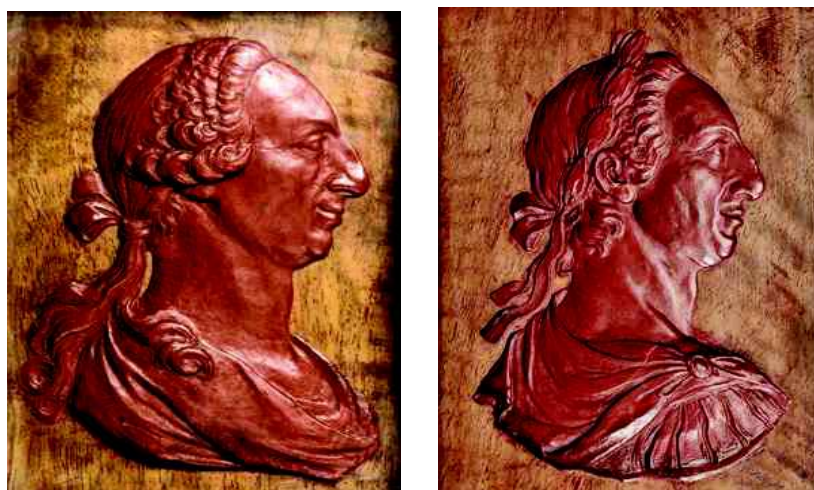
Fig. 6 y Fig. 7.- Estudios en cera roja sobre madera del grabador Tomás Francisco Prieto con los retratos de Carlos III para las monedas de plata que habrían de acuñarse en las casas de moneda metropolitanas e indianas

con manto (clámide) y larga doble coleta anudada, tal como establecería dos años después el artículo III de la Real Pragmática de 29 de mayo de 1772 al señalar que en las monedas labradas en las casas de moneda peninsulares “llevará mi real Busto desnudo con una especie de manto real”. En este sentido, hay que llamar la atención sobre el hecho de que para los distintos valores de la moneda de vellón Prieto utilizó el mismo prototipo de retrato regio que para las cecas peninsulares (peluca y larga coleta), pero con el busto desnudo, sin manto ni coraza. Así aparecería en todas las monedas de cobre labradas en la Real Casa de la Moneda de Segovia hasta el final de su reinado en 1833.