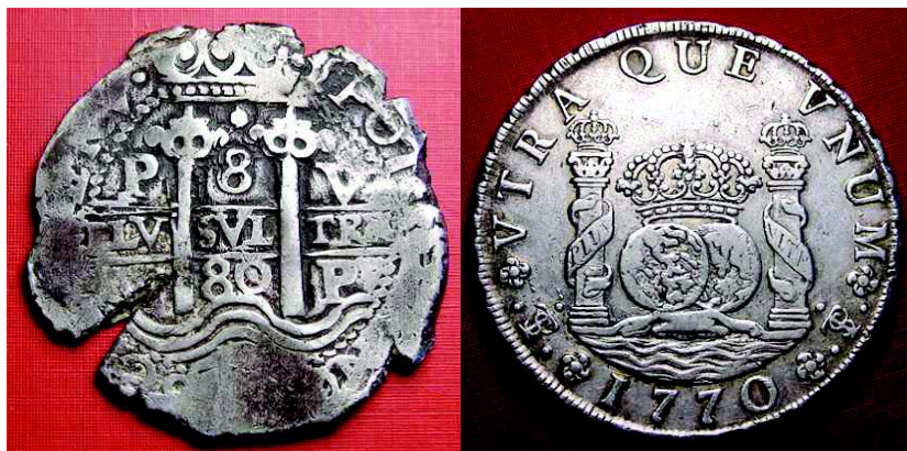
Fig. 1 y Fig. 2. -Moneda macuquina de real de a ocho (Potosí, 1680) y real de a ocho modelo “columnario” (Potosí, 1770)

En el siglo XVIII los distintos monarcas de la Casa de Borbón abordarían sucesivas reformas en los sistemas de acuñación de las monedas labradas tanto en las cecas peninsulares como en las ultramarinas. Hasta 1732, en Indias en concreto, estaba generalizado un prototipo de moneda que coloquialmente solemos denominar “macuquina”, un término que, al parecer, proviene del verbo romper en quechua. Estas monedas tenían una alta proporción de riqueza intrínseca de plata por lo elevado de su ley. Pero presentaba graves problemas a la hora de circular y ser aceptadas como medio de pago en el “comercio grueso” por su tosco sistema de acuñación y por la ausencia de uniformidad en sus morfología: toscas, mal troqueladas, con frecuencia recortadas con cizalla y con desajustes en los prensados, hasta el punto de que en el mundo de las monedas macuquinas lo raro es encontrar un “redondo”, ya que la mayor parte de las piezas tienen contornos muy irregulares, improntas no homogéneas dentro del campo, sin gráfila ni cordoncillo y, con mucha frecuencia, con desajustes o diferencias excesivas en el peso de las monedas. Aunque algunas superan los 27 preceptivos gramos, mucho más frecuentes son las que no llegan a alcanzar dicho peso, oscilando entre los 26 y 27 gramos, a veces incluso con menos gramaje. De hecho, como siempre se ha afirmado, no existen dos monedas macuquinas exactamente iguales dados los rudimentarios métodos de labranza y troquelaje de las piezas.