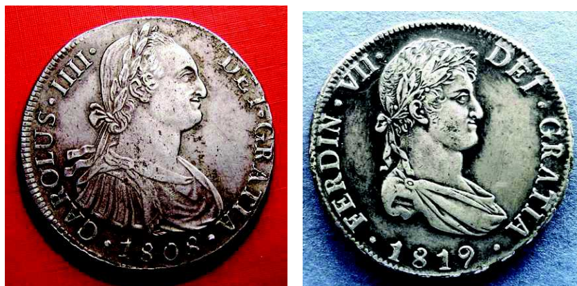
Fig. 11 y Fig. 12.- Reales de a ocho con los retratos de busto de Carlos IV (Lima, 1808) y Fernando VII (Potosí, 1819)

El grabador que diseñó el busto para el siguiente reinado, el de Fernando VII, fue el barcelonés Félix Sagau y Dalmau (1786-1850), sobre el que en 2013 publiqué un extenso estudio 16 . Tuvo que realizar Sagau el trabajo en unas condiciones difíciles y en pleno caos político y numismático tanto en España como en los reinos de Ultramar. Desde el punto de vista monetario, entre los años 1808 y 1811 llegaron a circular por los dominios del monarca ausente más de cinco bustos en las monedas: el de José I Bonaparte, el de Carlos IV con la leyenda de Fernando VII, el busto “indio” de la ceca de Lima, el busto “almirante” de la ceca de Santiago de Chile y el llamado busto “imaginario” de la Casa de la Moneda de México. Aquello era un caos que planteaba también problemas políticos por cuanto nadie sabía quién era y cómo era realmente el monarca