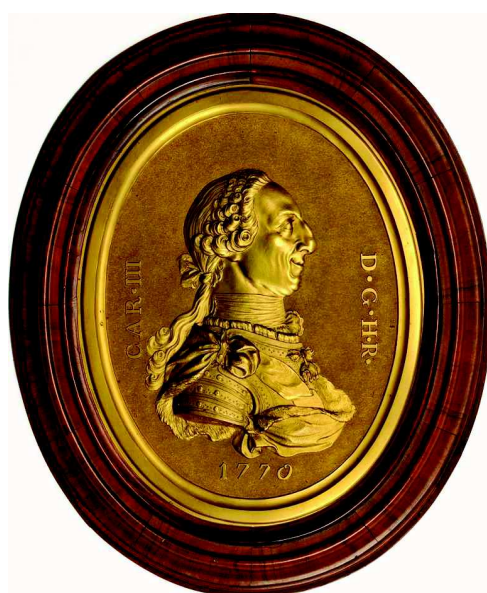
Fig. 5.- Estudio de Tomás Francisco Prieto del retrato de busto de Carlos III, fechado en 1770, para las monedas de oro peninsulares e indianas

Segovia -que se especializaría en las acuñaciones de vellón-, aunque en este muestrario a la izquierda del busto del monarca aparece el logotipo identificativo de la ceca de Madrid (una M coronada) y no los arcos del acueducto propio de la casa de moneda segoviana.