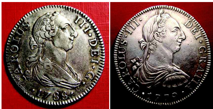
Fig. 8 y Fig. 9.- Moneda de dos reales acuñada en la ceca de Sevilla en 1788 y real de a ocho acuñado en 1779 en la ceca de México con las variantes del retrato de Carlos III

de la que sólo se aprecia la hombrera protectora de cuero. Este estudio en cera se ajusta, pues, a lo que dispondría dos años más tarde la Pragmática de 1772 al señalar en su artículo III que para las monedas acuñadas en plata en Indias “tendrá en el anverso mi real Busto vestido a la heroica, con clámide y laurel”, siguiendo con ello el modelo clásico -a la “heroica”- de las monedas de la Roma Imperial, sobre todo del periodo del Antiguo Imperio.