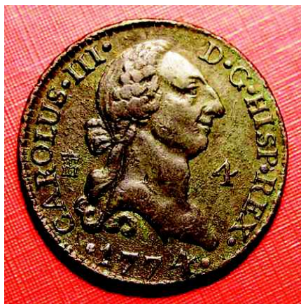
Fig. 10.- Moneda de vellón de cuatro maravedís acuñada en la ceca de Segovia con el retrato de Carlos III con busto desnudo

Dos años después de la muerte de Tomás Francisco Prieto, le sucedería en el cargo de grabador general de todas las casas de monedas de España e Indias su alumno -que era también su yerno, no lo olvidemos 14 . Pedro González Sepúlveda (Badajoz 1744-Madrid 1815), que en 1784 pasó a ser grabador de cámara de Carlos III y director de la Escuela de Grabado de la Real Academia de